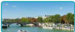
Passeio de Barco Rio Sena