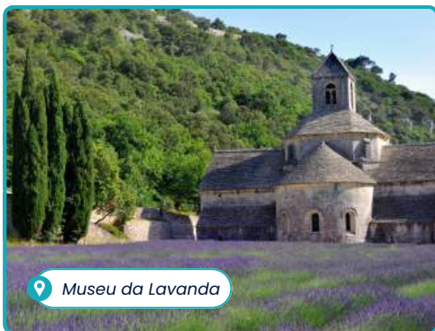
Museu da Lavanda