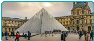
Museu do Louvre